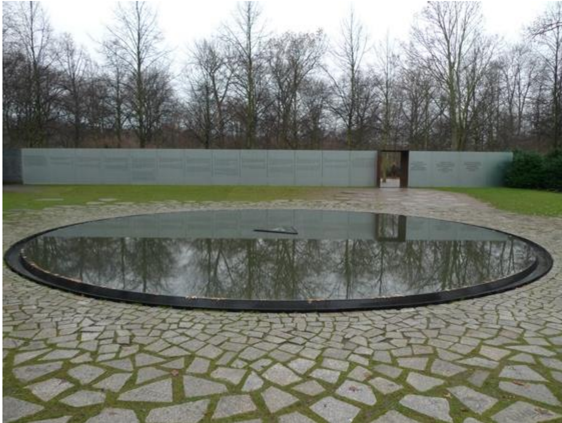
Mahnmal der im Nationalsozialismus ermordeten Sinti und Roma Europas