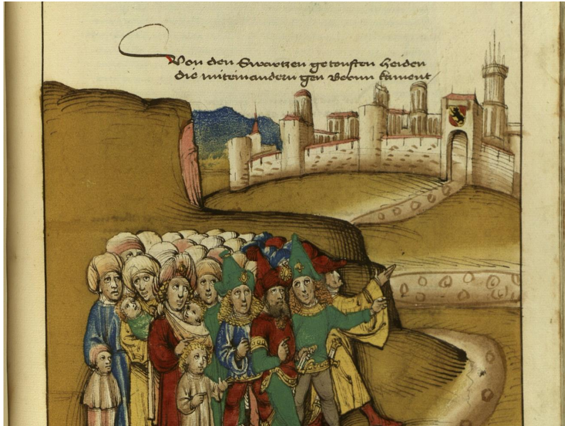
Sinti in Deutschland im 15. Jahrhundert