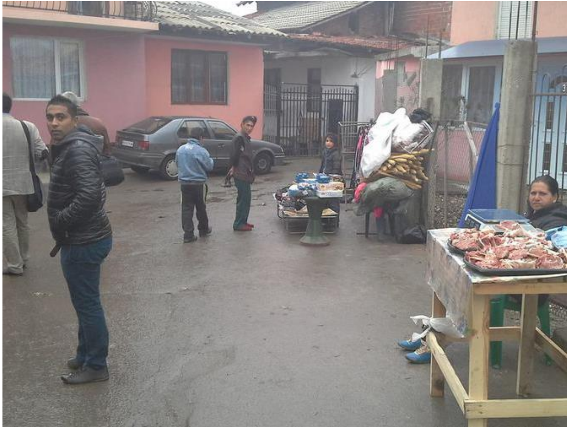
Roma Viertel Kyustendil (Bulgarien)