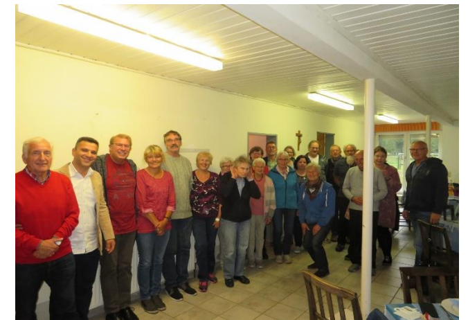
20 ehrenamtliche Mitarbeiter*innen